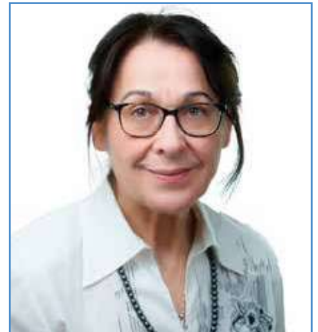
Πελίδου Συγκλητή-Ερριέτα Ιατρός Καθηγήτρια Νευρολογίας Πανεπιστημίου Ιωαννίνων