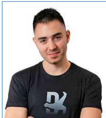
Κυρσανίδης Δημήτρης 5 φορές Παγκόσμιος Πρωταθλητής Παρκούρ