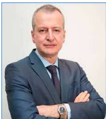
Ιντζές Ιωάννης Αντιστράτηγος ε.α., Επικεφαλής Θεμ. Εθνικής Αμύνας ΝΙΚΗΣ